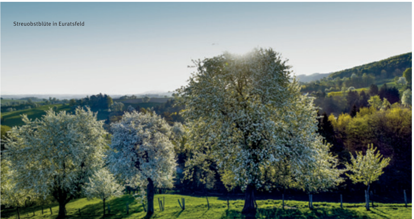
Streuobstblüte in Euratsfeld

Die Klimawandelanpassungsmodellregion (KLAR!) Amstetten unterstützt Gemeinden und Regionen dabei, sich auf diese Veränderungen einzustellen und resilienter gegenüber den Herausforderungen des Klimawandels zu werden.